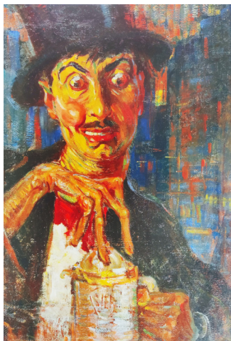
დომიტრი შევარდნაძე, არლეკინი, მუყაო, ზეთი, 36X56 სმ. საქართველოს ეროვნული მუზეუმი, თბილისი