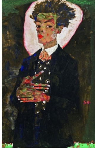
ეგონ შილე, ავტობორტრეტი ფარშევანგისფერ უილეტში, 1911. გუაში, აკვარელი და ფანქარი ქალაღდზე, 31,4 X44,8 სმ. ერნსტ პლოილის კოლექცია, ვენა