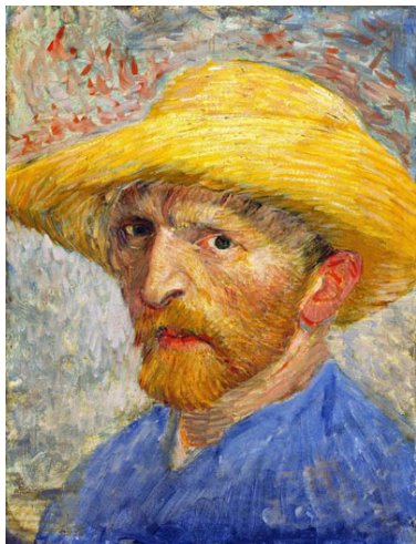
ვინსენ ვან-გოგი, ავტოპორტრეტი ჩალის ქუდში, 1887. ტილო, ზეთი, 54,5 X65 სმ. დეტროიტის ხელოვნების ინსტიტუტი, ამერიკა