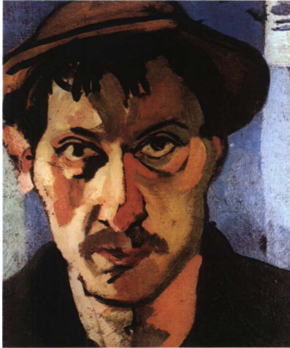
ანდრე დერენი, ავტობორტრეტი ქუდში, 1905. ზეთი, ტილო. დერენის კოლექცია, საფრანგეთი