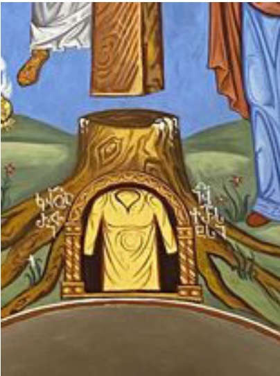
ზემო ბეთლემის მოხატულობა, „საქართველოს ეკლესიის დიდება“