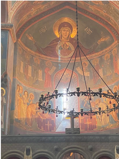
ზემო ბეთლემი, საკურთხევის კონქისა და აფსიდის მოხატულობა

რაც შეეხება საშემსრულებლო ხელოვნებას, მისთვის დამახასიათებელია შესრულების ხაზობრივ-დეკორატიული მანერა, ხაზი ტეხილია, დენადი, მსუბუქად შემოუყვება სხეულის ოდნავ მოცულობიან ფორმებს. ფიგურათა სახეების წერის მანერა კი ისეთია, თითქოს მათ უფრო მინიმალისტური შტრიხები ქმნიან, განსაკუთრებით ორმოც სებასტიელ მოწამეთა, მესვეტეების და სხვა კომპოზიციებში. ეს სახეები, ფორმები თითქოს აგრძელებენ იმ ისტორიულ მემკვიდრეობას, რაც ჩვენმა წინაპრებმა გვიმემკვიდრეს. ყველაფერი კანონიკურ ჩარჩოებშია მოქცეული, ტრადიციული მხატვრობისგან მხატვარი თავისუფალ წერის მანერას ვერ გამოავლენს და არცაა მხატვრის მიზანი. ჩემი აზრით, აქ გამოიკვეთა ზემოთ შენიშნული დიალოგი წარსულთან, ისტორიულ მხატვრობასთან, რადგან ამ დიალოგში ცხადდება ის ერთიანი, უწყვეტი ჯაჭვი, რასაც ჰქვია ქართული ფერწერა და იკვეთება მისი განვითარების ტენდენციები.