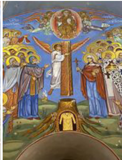
წმიდა ნინოს ეკლესია, „საქართველოს ეკლესიის დიდება“, დეტალი