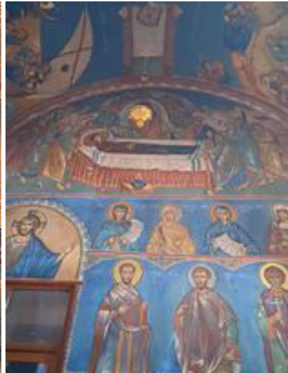
ზემო ბეთლემის ეკლესია ღმრთისმშობლის მიძინება