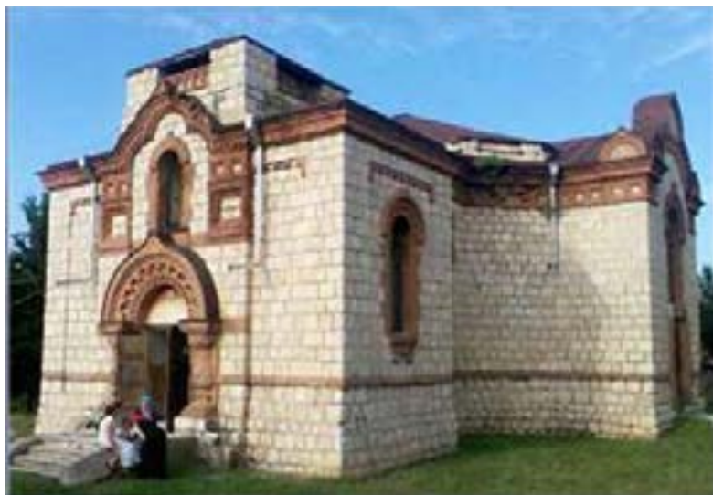
სამრეკლოს წმ. სერაფიმე საროველის ტაძარი 2012 წლის რეკონსტრუქციამდე.