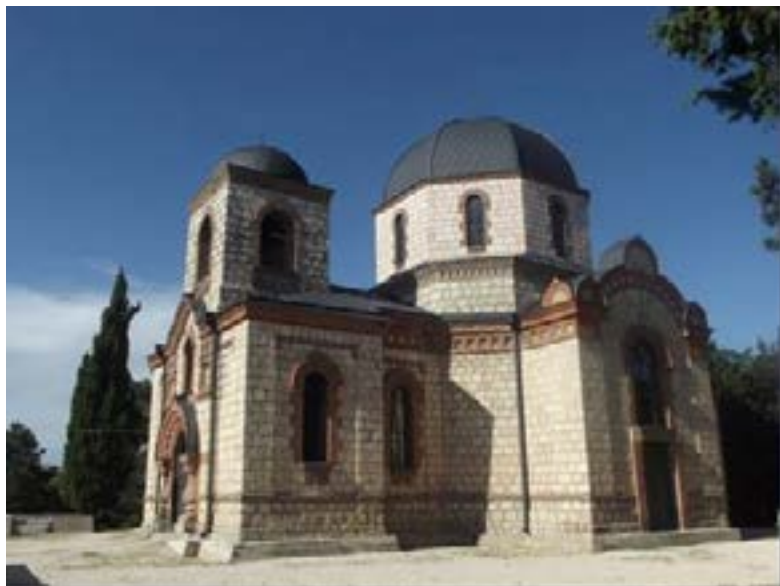
სამრეკლოს წმ. სერაფიმე საროველის ტაძარი 2012 წლის რეკონსტრუქციის შემდეგ.