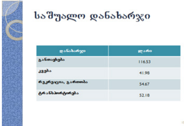
სურ. 2. ტურისტული დანახარჯების სტრუქტურა საქართველოს მთიანეთში 1

სარგებლობს, სადაც ისინი 98%-ს შეადგენდნენ, ხოლო უცხოელე-ბი მხოლოდ 2 %-ს. საშუალო დანახარჯმა ბაკურიანში ერთ ტურის-ტმე 169.50 ლარი შეადგინა. გუდაურში ეს მონაცემები შემდეგნაი-რია: